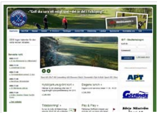
► Falköpings GK håller ordning på sina medlemmar m.h.a BravoAdmins Intranet 4.0

Med vår intranetmodul kan ni skapa lösenords-skyddade områden på er webbplats. För era kunder, er personal eller era samarbetspartners.